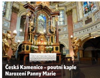
Česká Kamenice – poutní kaple Narození Panny Marie