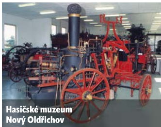
Hasičské muzeum Nový Oldřichov