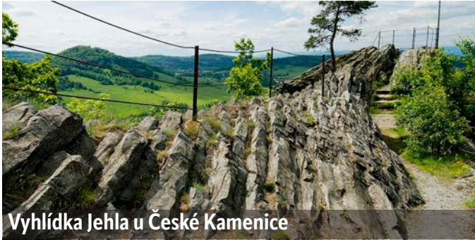
Vyhlídku Jehla u České Kamenice

Historický motoráček M 131.1302, přezdíváný „Hurvínek,“ vás odveze z České Kamenice po muzejní trati pod úbočím Zámeckého vrchu do sklářského města Kamenický Šenov, kde můžete navštívit sklářské muzeum či se vydat pěšky k legendární Panská skála, kde se natáčela Pyšná princezna, nebo na kole po cyklostezce Varhany, která vede po tělese zrušené trati od bývalého nádraží Kamenický Šenov horní nádraží až do České Lípy.